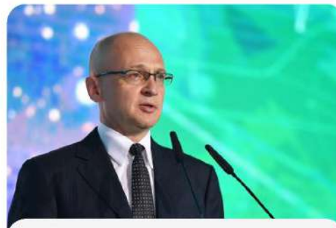
Кириенко Сергей Владиленович

Первый заместитель Руководителя Администрации Президента Российской Федерации